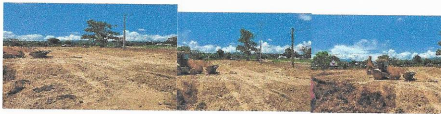
CONSTRUCCION DE LINEA DE DRENAJE Y EMPEDRADO AHOGADO EN CONCRETO EN LA CALLE ROMERO DE LA LOCALIDAD DE SAN PEDRO MUNICIPIO DE ATENGOMONTO TOTAL= $1,405,749.31.