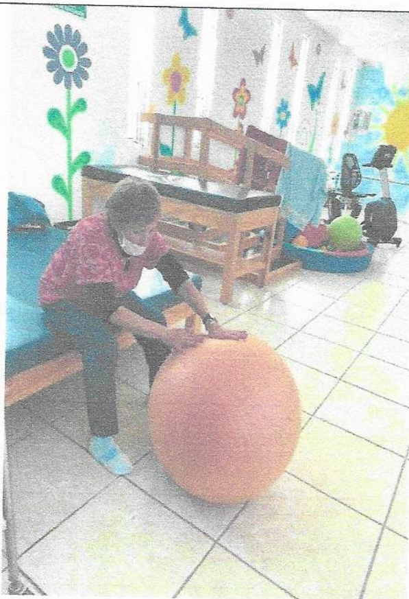
Rehabilitación para pacientes con patología crónica degenerativas.