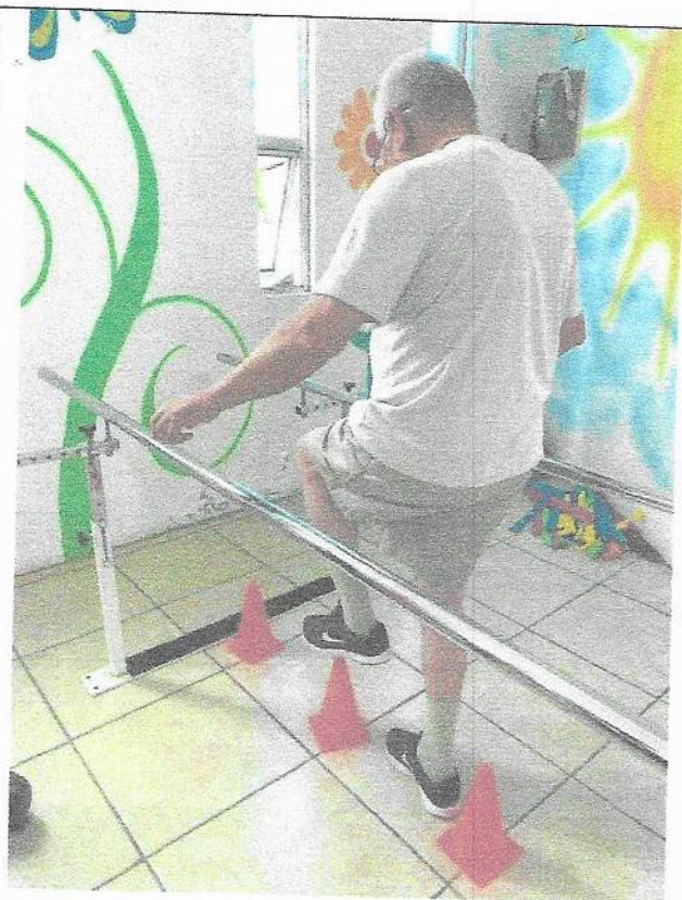
Rehabilitación en paciente posquirúrgico de columna.