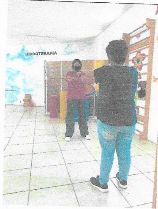
Rehabilitación en el área de trauma y ortopedia, osteosíntesis y retiro de material de codo.