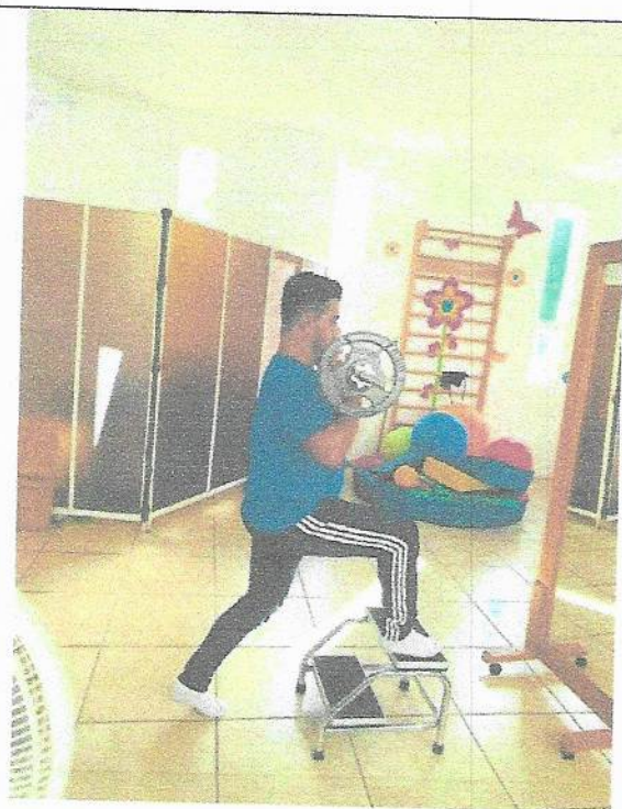
Rehabilitación en el área de trauma y ortopedia, posquirúrgico en plastia de tendón rotuliano.