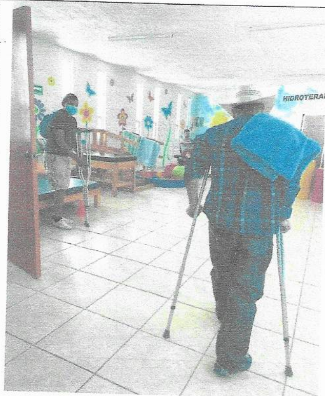
Rehabilitación en el área de trauma y ortopedia, posquirúrgico de fractura de codo.