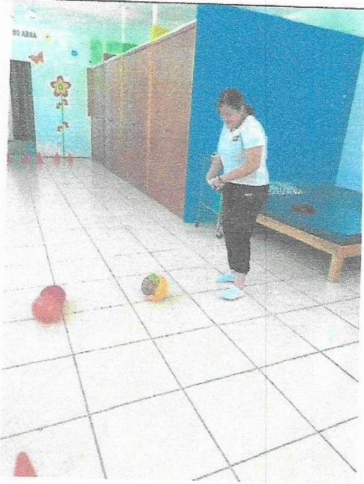
Rehabilitación en el área de trauma y ortopedia, por síndrome femoropatelar por subluxación bilateral de rotulas.