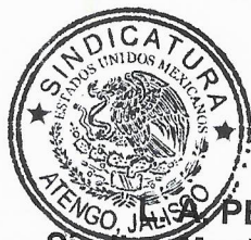
PEDRO RAMOS PEÑA Síndico Municipal del H. Ayuntamiento Constitucional de Atengo Jalisco