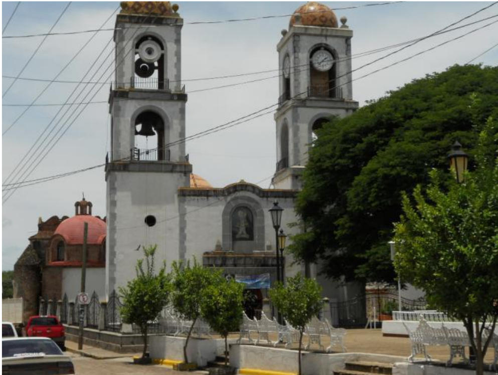
El Templo de Nuestra Señora del Rosario.

El templo Antiguo de Atengo que data de 1620 y el nuevo Santuario de la Basílica de Nuestra Señora de la Natividad de Atengo. En 1598 la milagrosa imagen de Nuestra Señora de la Natividad, originaria de Pátzcuaro, Michoacán, fue traída al pueblo de Atengo, por el padre Fray Diego Serrano. Sus rasgos denuncian que es una obra hecha bajo los cánones de la escuela de los ídolos indígenas de Michoacán, alrededor de 1520 – 1530. Esta milagrosa imagen de Nuestra Señora de la Natividad está hecha de pasta de caña de maíz. El 11 de enero de 1948, es agregado el Santuario de La Virgen de Atengo a la Basílica Lateranense.