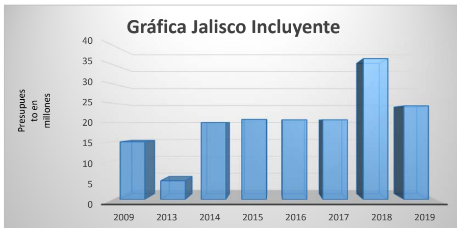
Gráfica 1. Monto anual del presupuesto (en millones de pesos) asignado al programa "Vive Incluyente" 2009 y "Jalisco Incluyente" 2013-2019.

Fuente: Elaboración propia con datos obtenidos del Periódico Oficial del Estado de Jalisco 2009, 2013-2018.