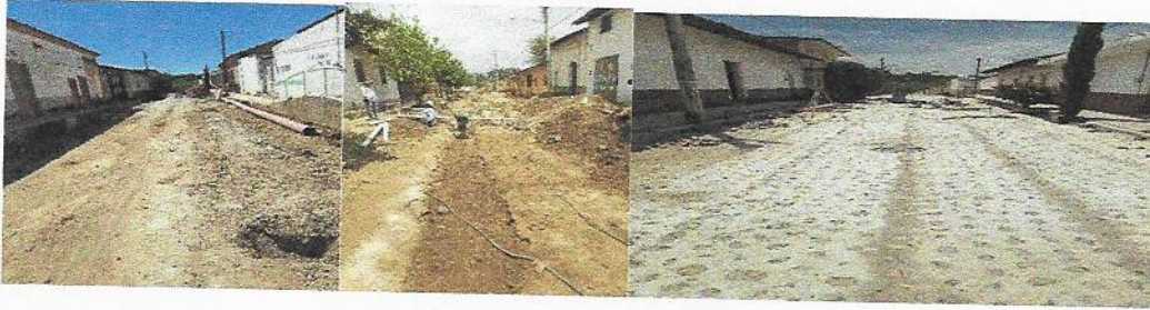
CONSTRUCCION DE ESPACIO DE USOS MULTIPLES EN LA LOCALIDAD DE TACOTA. MONTO TOTAL= $682,539.17